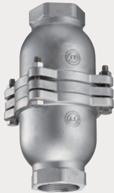
Fig No.940 ●ステンレス製フランジ型中間フットバルブ